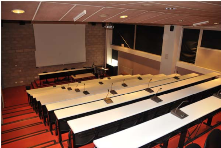
Amphithéâtre de 120 places