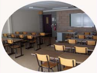
Salle de cours n°11