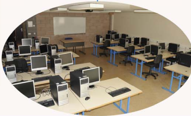
Salle info. n°13