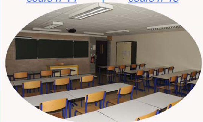
Salle de cours n°14