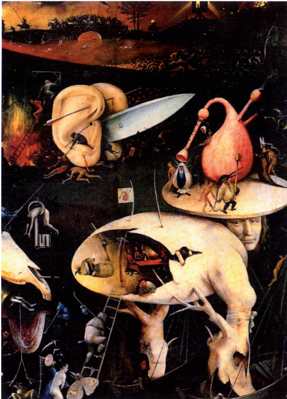
Triptyque du jardin des délices (détail du panneau droit), Jérôme Bosch, peinture sur bois, 220 x 195 cm, vers 1500, Musée du Prado, Madrid.